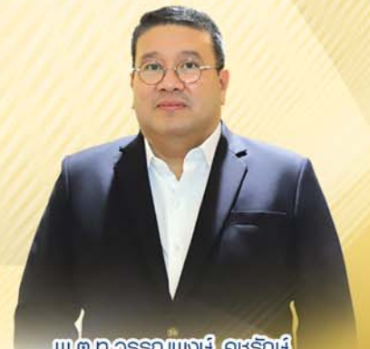
พ.ต.ท.วรรณพงษ์ คชรักษ์ อธิบดีกรมพินิจและคุ้มครอง เด็กและเยาวชน