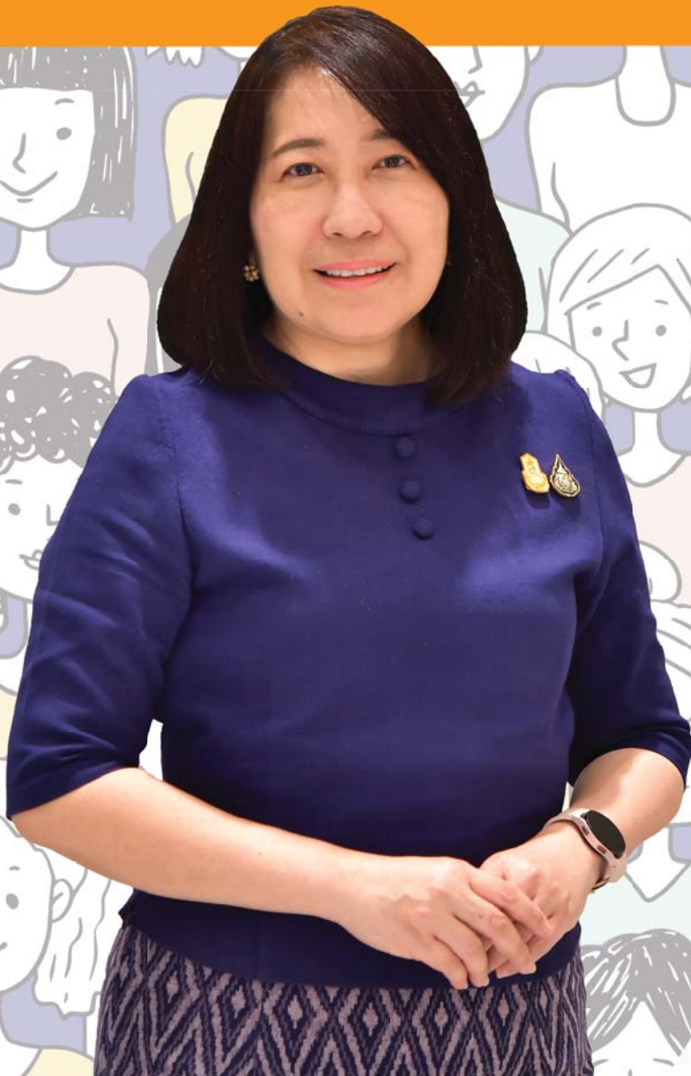
นางพงษ์สวาท กายอรุณสุทธิ์ ปลัดกระทรวงยุติธรรม