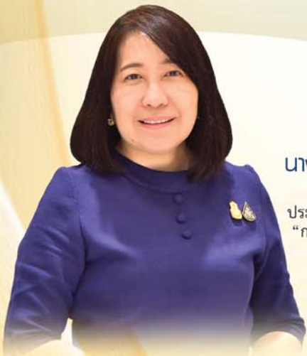
นางพงษ์สวาท กาชอรณสุภร์ ปลัดกระทรวงยุติธรรม

ณ สถาบันเพื่อการยุติธรรมแห่งประเทศไทย (TIJ) ถนนแจ้งวัฒนะ เขตหลักสี่ กรุงเทพฯ